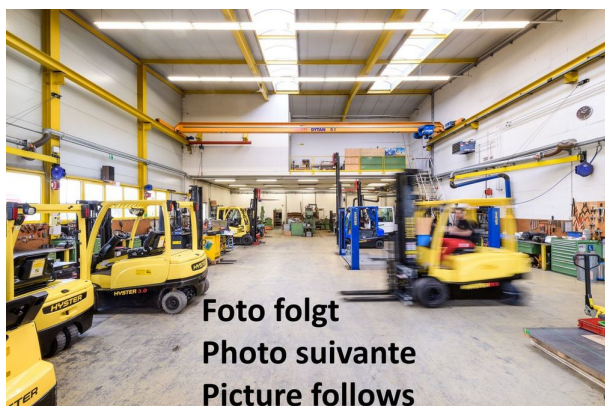
Foto folgt Photo suivante Picture follows