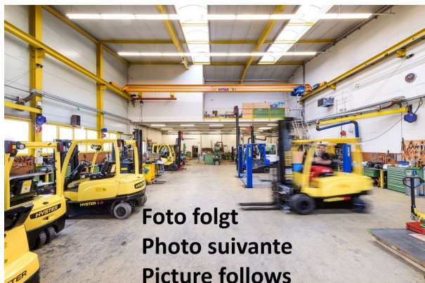
Foto folgt Photo suivante Picture follows