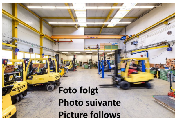
Foto folgt Photo suivante Picture follows