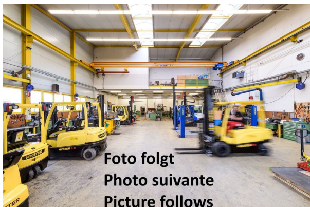
Foto folgt Photo suivante Picture follows

Marque: Hyster Modèle: P2.0 Type: Transpalette Catégorie: Transpalette électrique Capacité: 2000 kg Type de mât: Aucun Numéro de commission: 8459